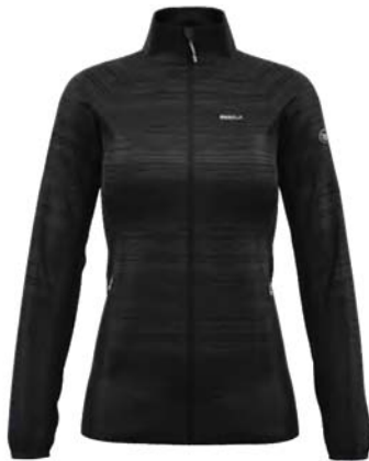
M999 / 179