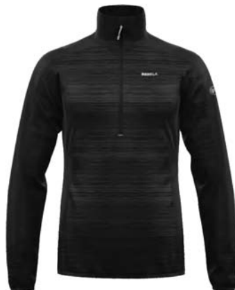
M999 / 999