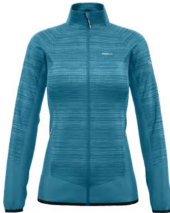
M700 / 700