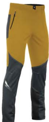
288 / 357