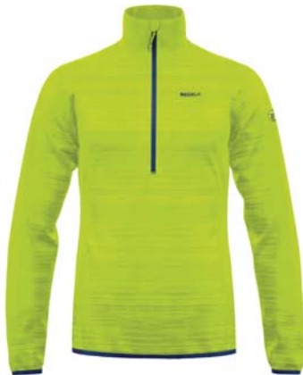
M207 / 207