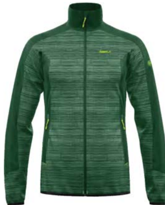
M436 / 436