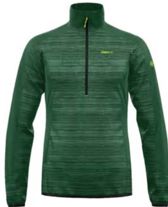
M436 / 436