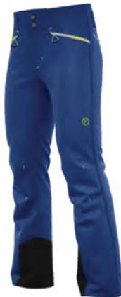
761 / 207