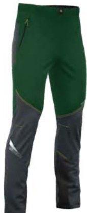
436 / 357