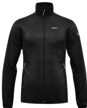
M999 / 999