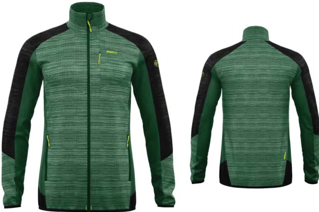
M436 / M999