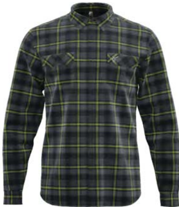
Q-4 / 207