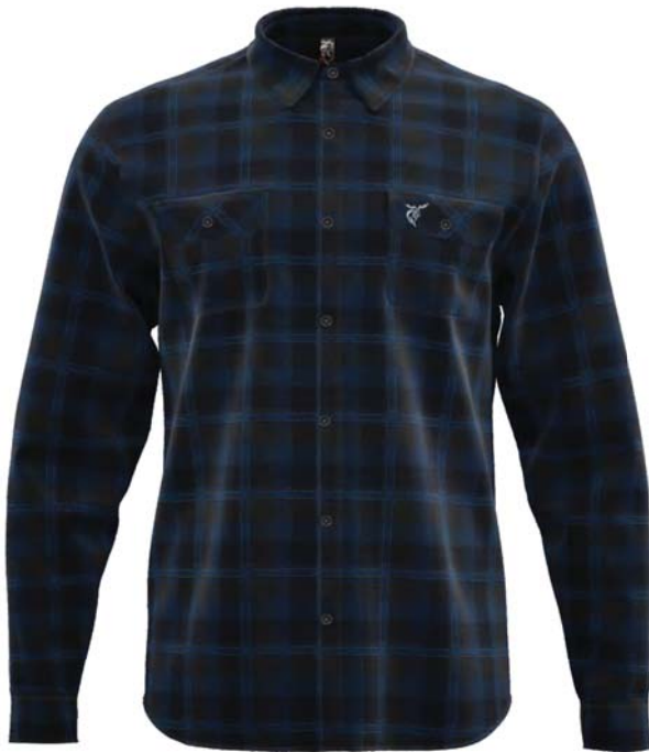
Q-7 / 357

Camicia manica lunga - Long sleeve shirt