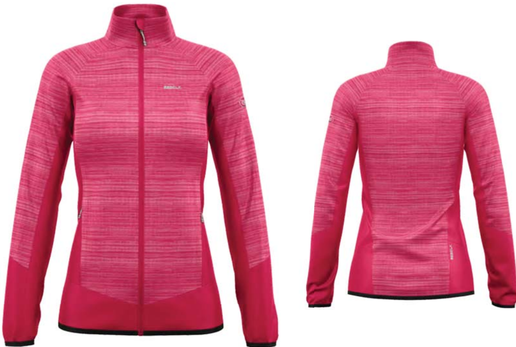
M178 / 179