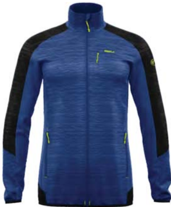
M761 / M999