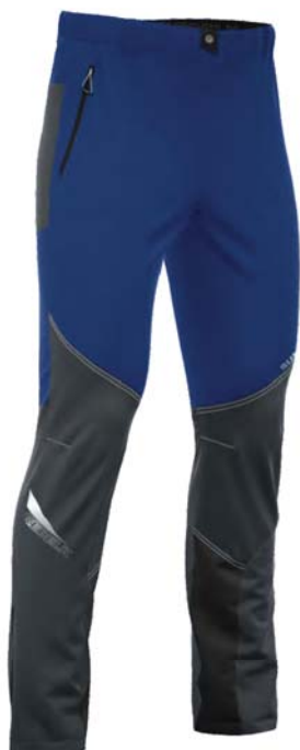
761 / 357

Pantalone sci alpinismo vestibilità unisex - Ski touring pants unisex fit