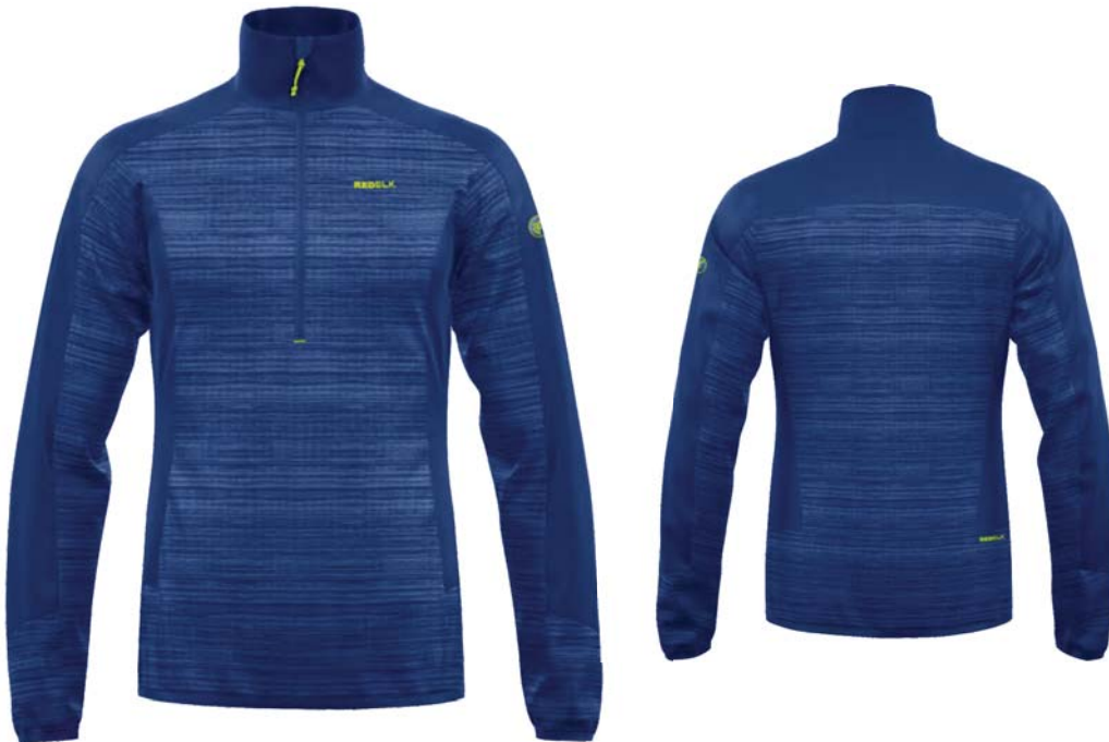
M761 / 761