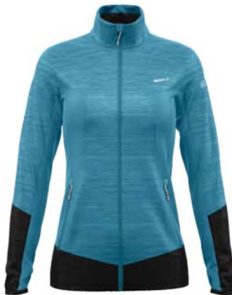
M700 / 700