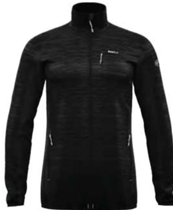
999 / M999