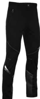
999 / 999