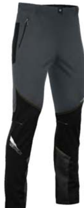
357 / 999