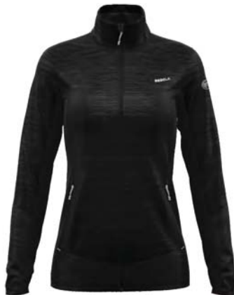
M999 / 999