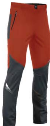
848 / 357