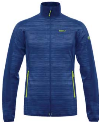
M761 / 761