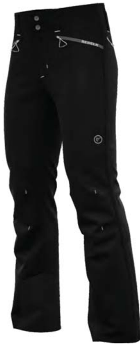
999 / 357

Pantalone tecnico vestibilità unisex - Technical pants unisex fit